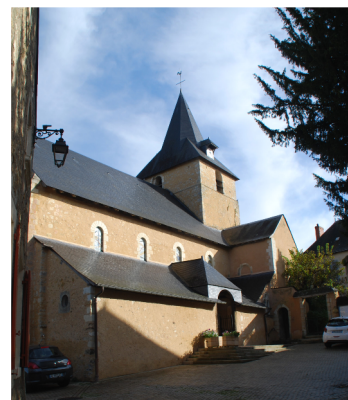
La Preĝejo Sankta Sylvestre

La Kastelo de Malicorne , 18a jarcento, protektata per profundaj foskavoj. Malantaŭ la kastelo oni povas admiri belan parkon.