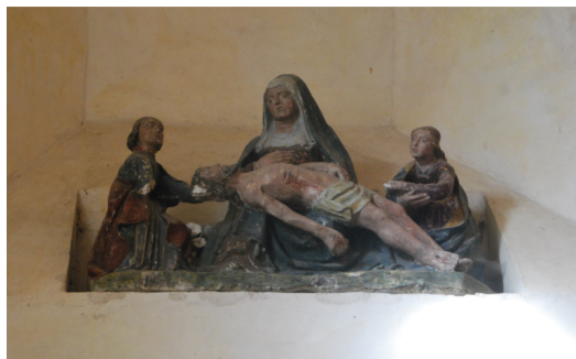
La Pieta el terakoto

Tie la karoso malsupreniris la straton Bel-Ebat kaj ĉirkaŭiris la romanikan kirkon fonditan en 1080.