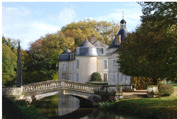
La Muelo de Malicorne

Tamen Malicorne ne atendis la famon de siaj fajencoj por sciigi sian propran vivarton !