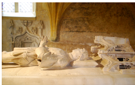
La Kuŝo-statuo de Chaources

La preĝejo Sankta Sylvestre kies konstruo datiĝas de 1080. Ĝi estas romanika kaj havas imponan sonorturilon, malregule aĵuritan. En la kapelo Sankta Anne oni malkovras la kuŝo-statuon.