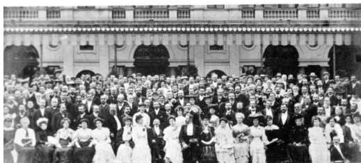
La unua kongreso en 1905 kie kunvenis pli ol 700 homoj

Dum 114 jaroj okazis 104 kongresoj, bedaŭrinde mankis pluraj, dum 10 jaroj, pro la du mond-militoj. (1914-1918) (1939-1945).